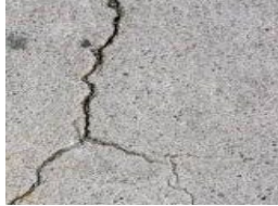
Тротуар с трещинами

Подъем или опускание тротуара более чем на полдюйма. Варианты ремонта: от 0 до 2 дюймов – можно отшлифовать. Более 2 дюймов – необходимо заменить.